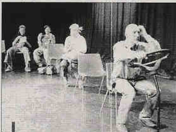
Une pièce de théâtre où Mike, le gamin devenu chauffeur, a bien du mal à maîtriser les jeunes usagers de son bus.

La représentation terminée, un vrai chauffeur de bus a animé un débat pour que ce petit monde mesure l'importance et